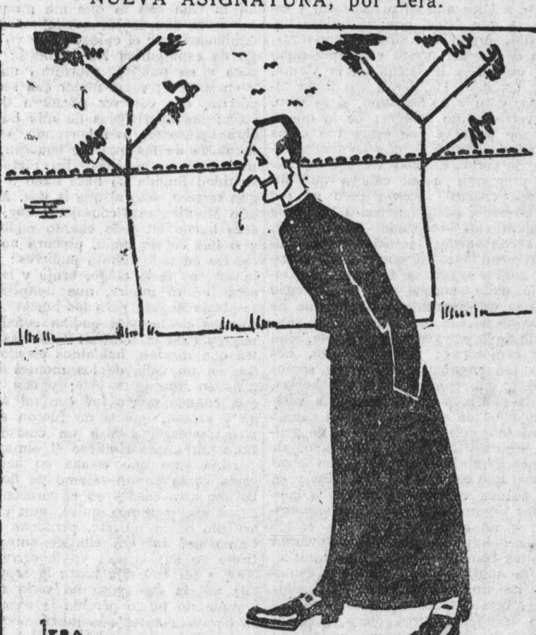
EL SEMINARISTA.—Pues, señor, yo creo que además del Latín, del Derecho Canónico, de la Teología y de la Apologetica, nos debieran enseñar Táctica militar.