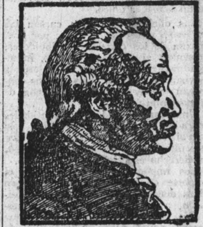
ma. Es autor de un sistema filosófico por el cual se someten a la crítica todos los conocimientos humanos, de donde tomó su doctrina el nombre de criticismo. Al estudio del sistema kantiano dedicó Carlos Marx preferente atención en sus comienzos. Las obras más notables de Kant, y que contienen los fundamentos de sus teorías, son: Crítica de la razón pura, Crítica de la razón práctica y Crítica del juicio.

La Diputación provincial no está acertada al negarse, de la manera que lo hace, a admitir a los cancerosos que no son de Madrid o su provincia. La vida de una persona, de una sola, vale mucho más que todas las pesetas juntas que pierden al arrastrarse la Corporación al poner en práctica tan funesto acuerdo.