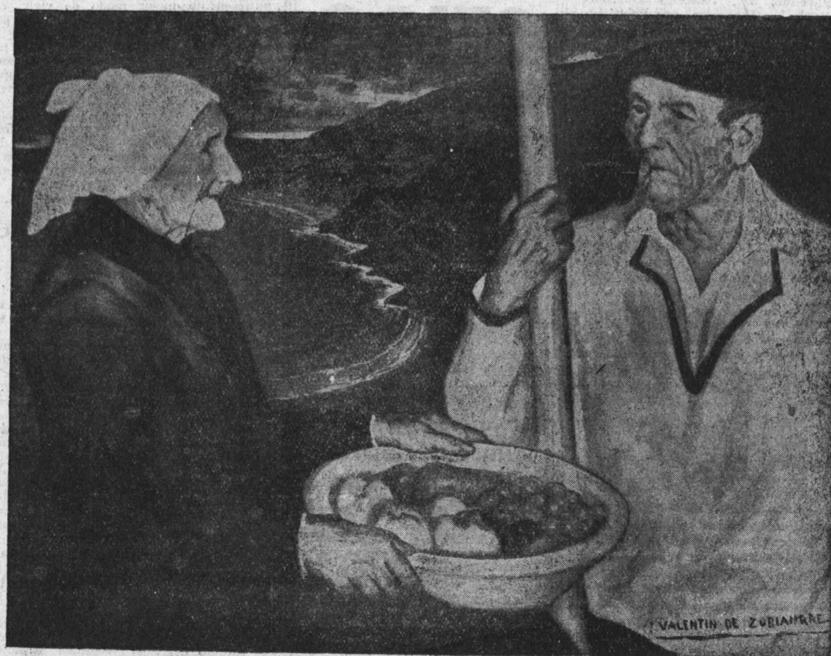
«Joshepa y Antón» (tipos vascos), cuadro que se exhibe en la Exposición del Círculo de Bellas Artes.