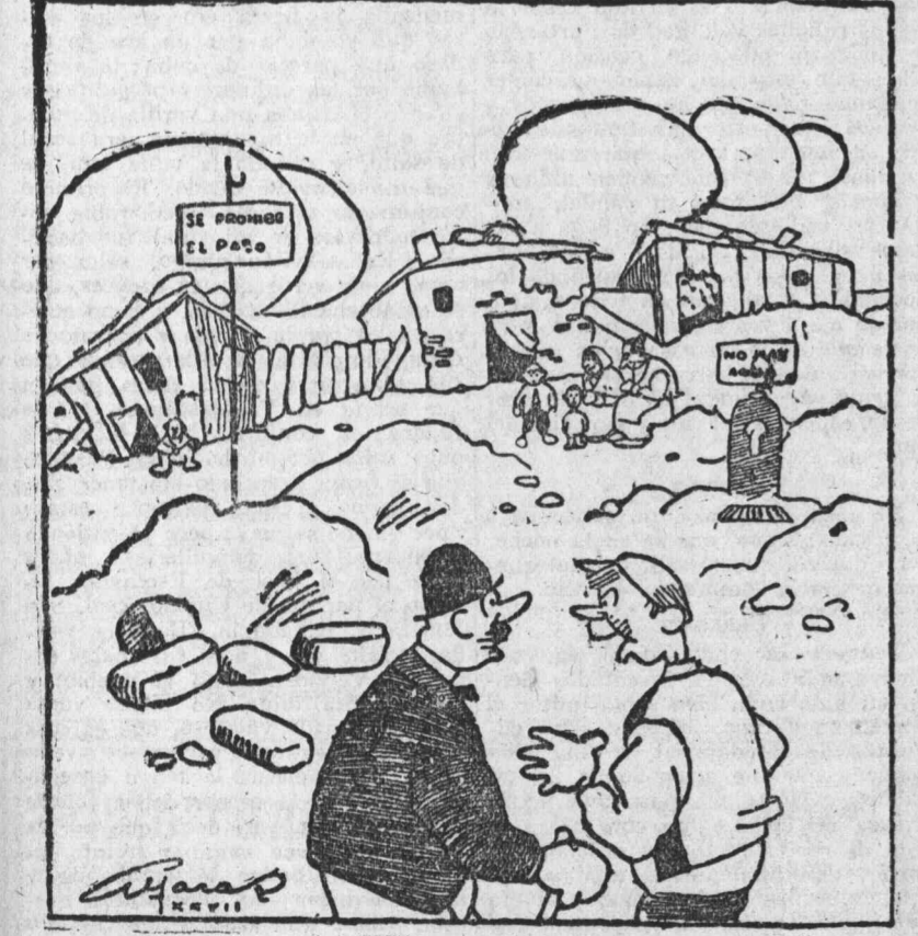
— Ya ve usted, mucha higiene, mucha higiene, y fíjese en qué abandono estamos. ¡Ni agua para lavarnos tenemos!