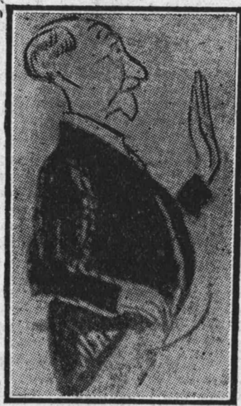
Carlos Maurras, de «L'Action Française», condenado a un año de prisión por amenaza de muerte contra un ministro.

Falto de su principal apoyo, que era el general, comenzó el efímero reinado de don Amadeo bajo malos auspicios. Las rivalidades entre los jefes de los partidos del régimen, que se sucedían en el Gobierno a cada paso; la sublevación antillana y el levantamiento de las partidas carlistas en el Norte y de los federalistas en