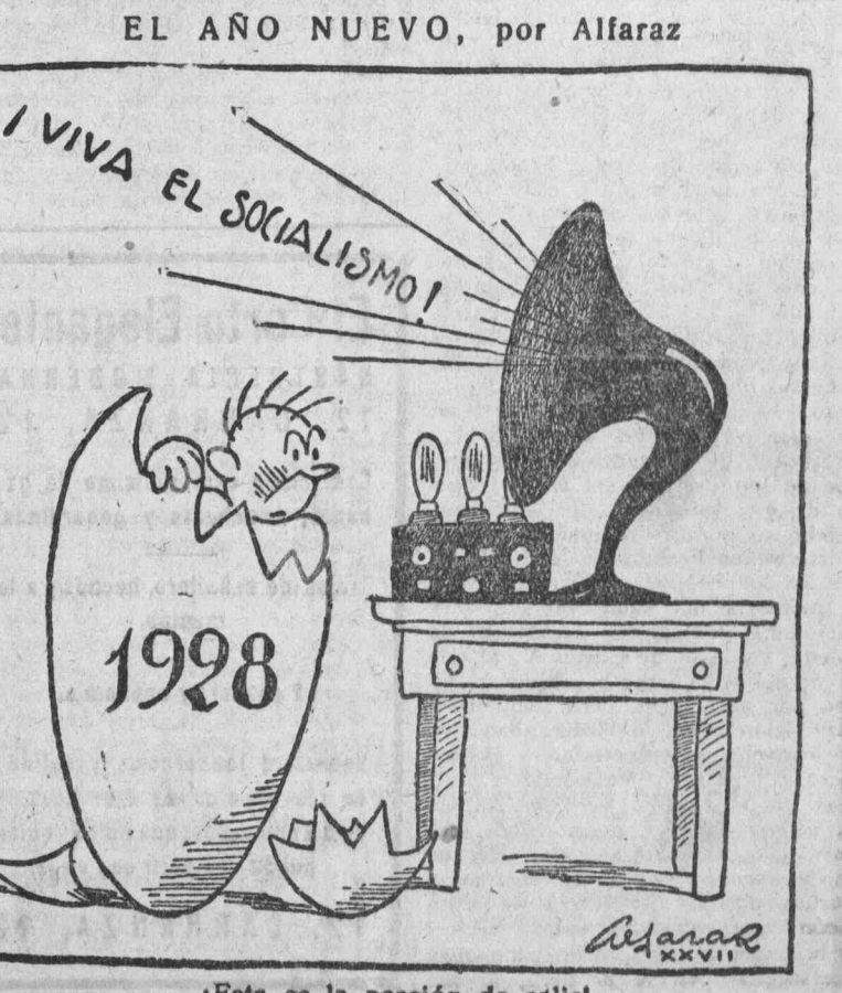
[Esta es la ocasión de salir]

De las 14 entidades que han sido baja, una, la de Béjar, está en reorganización; la de Madrid (Grupo Femenino) se ha fusionado, sin pérdida de afiliados, con la Agrupación, y nueve pertenecen a la región asturiana, donde la crisis económica es agudísima y vive de milagro tanto la organización sindical como la política. No hay, pues, pérdida efectiva en el balance del año, que ha sido malísimo para nuestro Partido, por la prolongación del régimen de dictadura, por la escasez de recursos para la propaganda y, sobre todo, por la crisis de trabajo. En general, nuestras Secciones mantienen su fuerza, y hasta la aumentan; aunque es de suponer que en el año venidero, con la propaganda reducida, menos de la necesaria, pero más que en años anteriores, se acrecentará el número de cotizantes y el de Secciones, con ocasión de celebrarse el Congreso ordinario, convocado para 1.º de abril de 1928. De aquí a esta fecha, pues, el deber de todos habrá de consistir en procurar por todos los medios aumentar el número de cotizantes en el Partido, para presentar un buen balance. Porque donde no haya socialistas, y socialistas de verdad, decididos a trabajar por la organización obrera, ésta tendrá vida efímera e insegura. Dentro del Partido, donde están la Unión General y nuestra convención, nuestro deber y nuestra convicción es que cada revolucionario