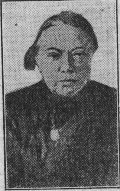
La viuda de Lenin, que ha fijado su residencia en Londres.

Y que tienen razón los periodistas que así piensan es lo que nos proponemos demostrar.