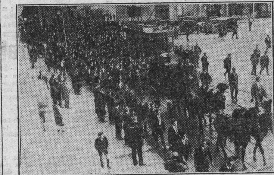
EL COCHE FUNEBRE Y LA PRESIDENCIA DE LA MANIFESTACIÓN POSTUMA EN HONOR DE MEABE

De la zona fabril y minera vinieron numerosísimas representaciones de todas las colectividades societarias y socialistas,