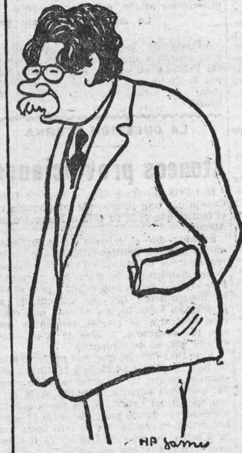
FEDERICO ADLER Secretario de la Federación Socialista Internacional.