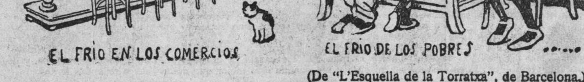
(De «L'Esquella de la Torratxa», de Barcelona.)