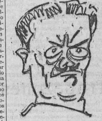
Señor Condylis, jefe del Gobierno de Grecia.