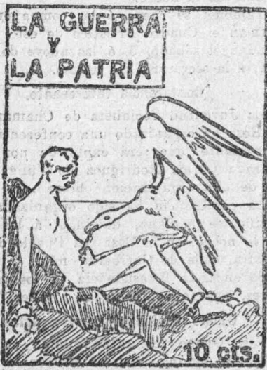
LA GUERRA y LA PATRIA

En todas las farmacias rigen las tarifas económicas.